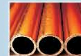
Tuberías de acero, cobre y pvc