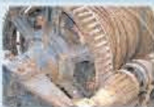
Repuestos y equipos