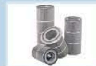
Filtros de aire y aceite