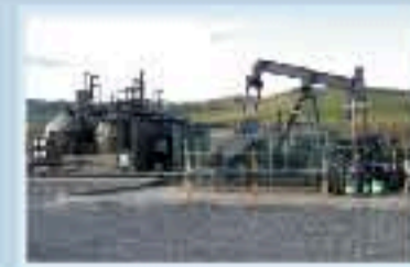
Equipos y productos para la explotación y refinación de petróleo

FTI representa a múltiples empresas norteamericanas, fabricantes de equipos, repuestos y servicios dentro de las siguientes categorías: