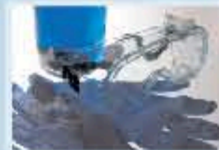
Equipo de Seguridad Industrial