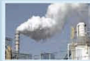
Plantas de generación eléctrica