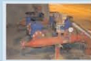
Válvulas, acoples y reguladores