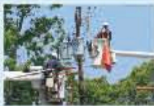
Productos para reparación y mantenimiento