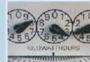
Productos e instrumentos eléctricos