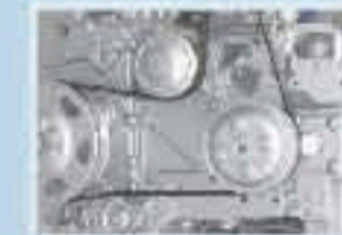
Motores, Bombas y Compresores