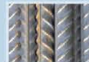
Materiales de Construcción